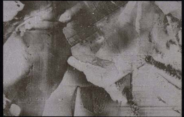
Negro Preto Black