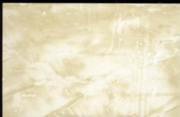
Verde Caqui Verde caqui Khaki