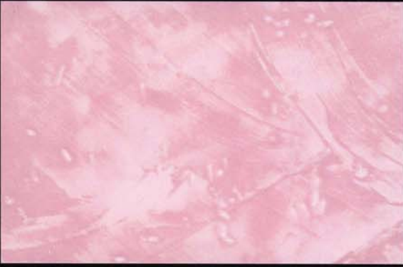
Violeta Violeta Violet