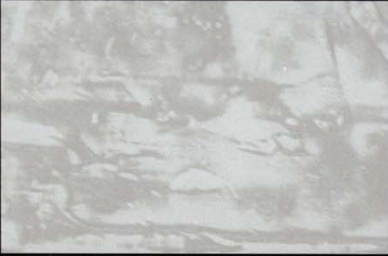
Gris Cinzentu Grey