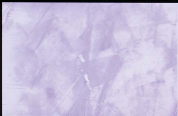
Lila Lilás Purple