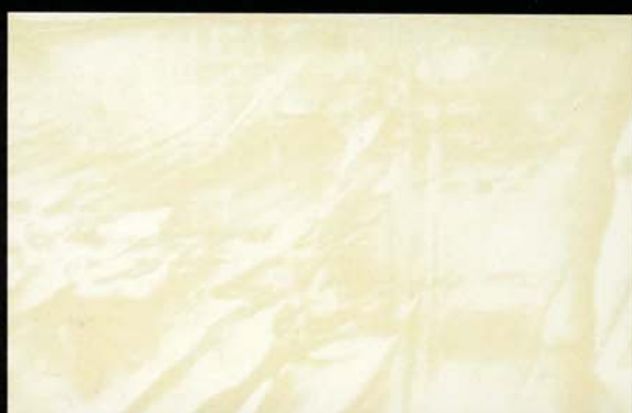
Hueso Osso Off-white