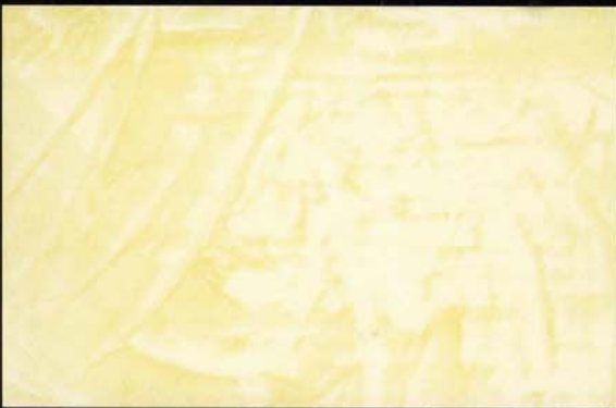
Piedra Pedra Stone