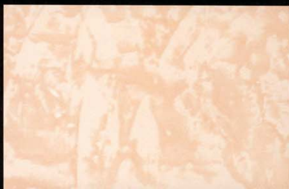
Salmón Salmão Salmon