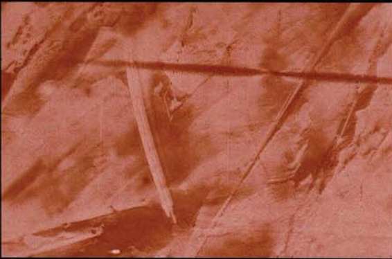
Rojo Alicante Vermelho Alicante red