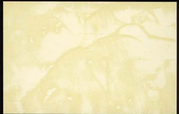
Marfil Marfim Ivory