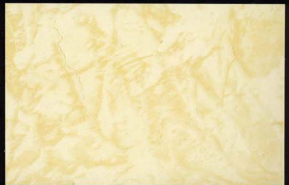
Crema Claro Creme claro Light cream