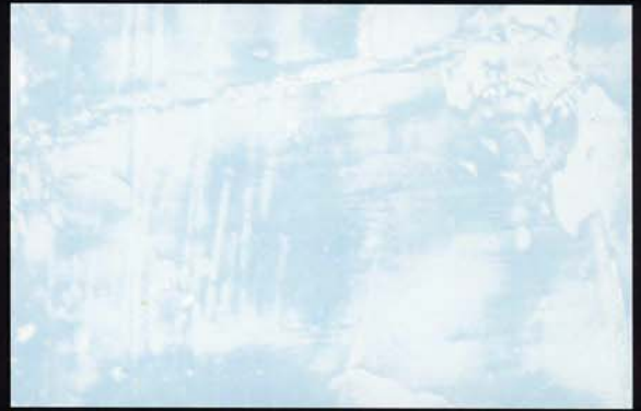
Azul Cielo Azul céu Sky blue