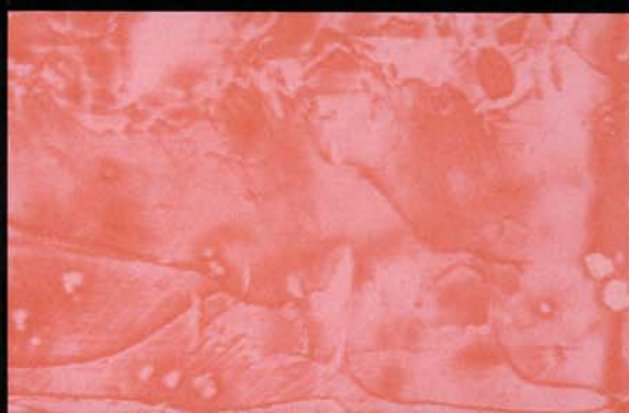
Rojo Ladrillo Vermelho tijolo Brick-red