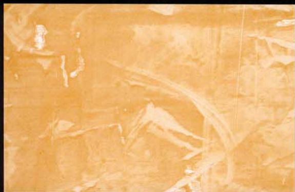
Crema Oscuro Creme escuro Dark cream