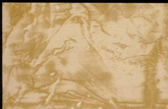
Marrón Castanho Brown