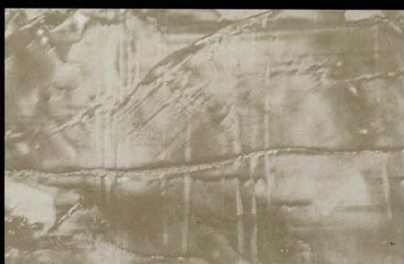
Gris Oscuro Cinzento escuro Dark grey